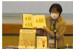
【親子で絆を深めよう～読書を通して】～講話】