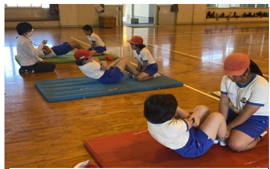
上体起こし(30秒で何回できるかな)