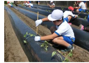
棒を使って、押し込んで植えていきます。