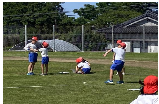
ソフトボール投げ

シャトルランなどの種目を終えると、集計作業に入ります。鹿児島県や全国平均と比べて、粟ヶ窪小の子供の運動能力はどのレベルにあるのか、結果が楽しみです。