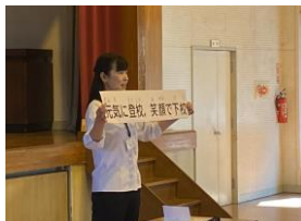
校長先生のお話 (全校朝会)