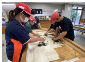
熱心にお茶体験に取り組む6年生