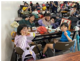
楽しいお弁当の時間

5月19日は、春の一日遠足でした。知覧特攻平和会館やミュージアムなどの平和学習の後、午後からはアグリランドに向かいました。お茶体験コーナーでは、実際に茶葉から製品にするまでの過程を児童全員が体験しました。最後は製品としてお茶を持ち帰ることもでき、充実した体験となりました。