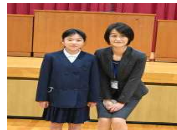
6年生 (6年; 1名)