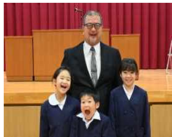
2・4年生 (2年; 1名, 4年; 2名)